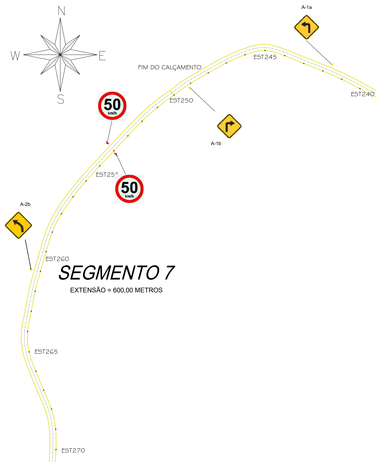
SEGMENTO 7 EXTENSÃO = 600,00 METROS